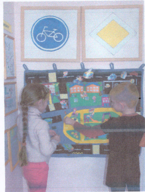
Уголок по БДД, холл первого этажа, холл второго этажа МБДОУ д/с № 78